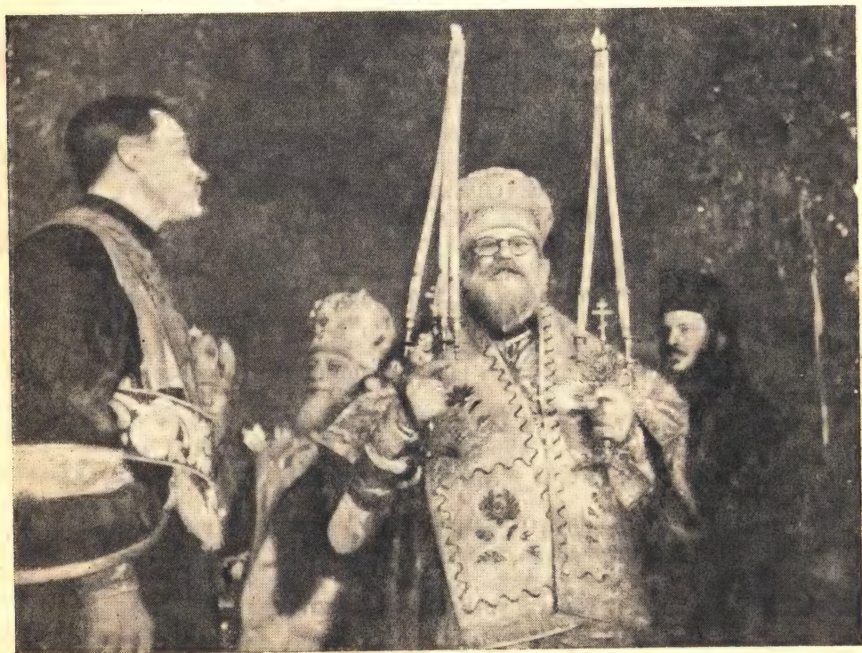
Блаженнейший Патриарх Александрийский Христофор во время литургии 4 февраля

«Благодарю Ваше Блаженство, за Вашу любовь к моему достоинству».